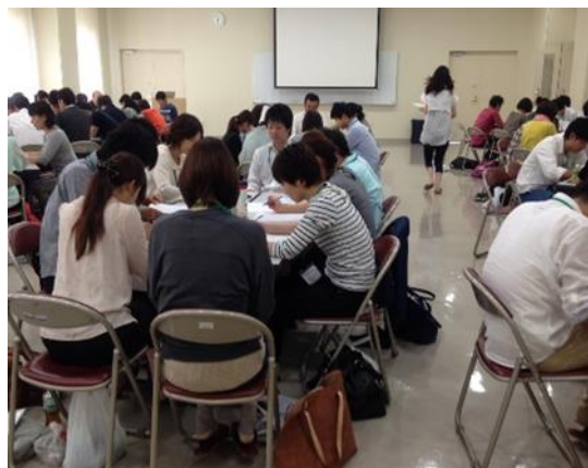
編集／生活行為向上マネジメント連携推進チーム（担当：濱田）